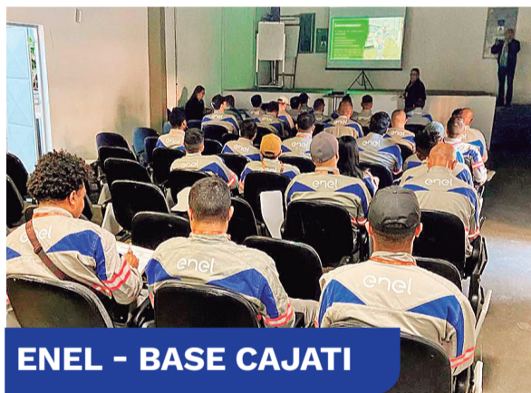
ENEL - BASE CAJATI